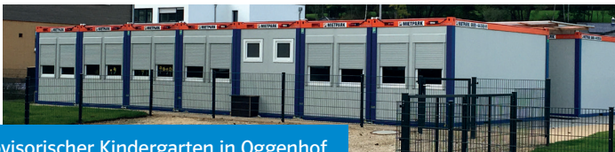
Provisorischer Kindergarten in Oggenhof

Im Februar musste über den Standort des provisorischen Kindergartens Willishausen entschieden werden. Neben der Nähe zu Willishausen waren auch die Erschließungskosten der beiden möglichen Standorte (Hartplatz Schule Diedorf oder Bauplatz Ziegeleigelände) von Bedeutung. Leider hat der Bürgermeister die Kostenaufstellung nicht wie vereinbart dem Gemeinderat schriftlich vorgelegt. Es wurde lediglich ein Betrag von 5.800 € für die gesamte Erschließung im Oggenhof genannt (vgl. AZ vom 21.02. und Protokoll der Marktgemeinderatssitzung vom 14.02.2017). Der Bürgermeister erklärte damals, dass die Kosten in Diedorf etwas niedriger seien. Da der Beschluss wieder einmal unter hohem Zeitdruck gefasst werden musste, hat der Gemeinderat dem günstiger gelegenen Standort Oggenhof zugestimmt, ohne die exakten Kosten zu kennen. Inzwischen stehen die Container und der Kindergarten hat darin seinen Betrieb aufgenommen. Der Garten kann leider noch nicht genutzt werden, da der Rasen nicht rechtzeitig gesät wurde. Auf Anfrage wurden dem Gemeinderat im September die tatsächlichen Erschließungskosten des Platzes (ohne Zaun und Containeraufstellung) mitgeteilt. Diese betragen 30.069 € , was einer Kostensteigerung von über 500 % entspricht.