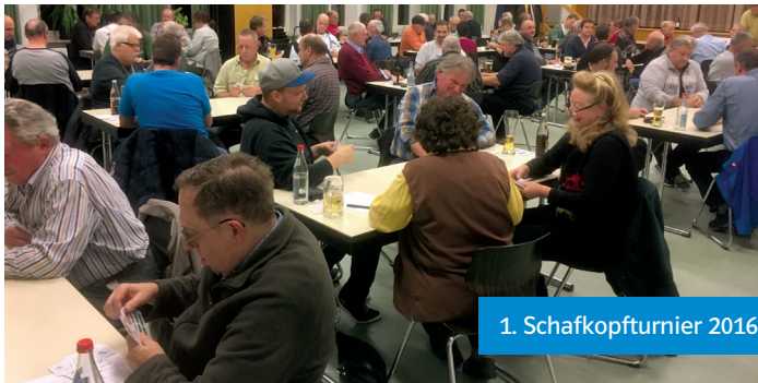
1. Schafkopfturnier 2016

Es winken fünf Geld-Preise, deren Höhe entsprechend der Teilnehmerzahl ausfällt. Für das leibliche Wohl ist gesorgt.