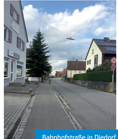
Bahnhofstraße in Diedorf

2014 wurde die Sanierung der Bahnhofstraße beschlossen. Nun wird das Projekt in Angriff genommen. Die Umlage soll gemäß der geltenden Beitragssatzung auf die Anwohner verteilt werden. Da die Kosten pro Anlieger sehr hoch sind und die Straße aufgrund Gymnasium und Bahnhof auch für das Gemeindewohl wichtig ist, haben wir vorgeschlagen, nach einer Lösung zu suchen, um deren Beteiligung geringer zu halten.