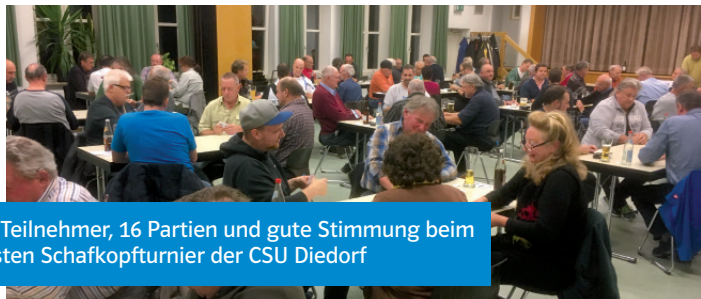
64 Teilnehmer, 16 Partien und gute Stimmung beim ersten Schafkopfturnier der CSU Diedorf

Auch im neuen Jahr wird jeden ersten Freitag im Monat um 20:00 Uhr unsere Schafkopfrunde in der TSV Sportgaststätte Diedorf in der Nebelhornstraße stattfinden. Alt und Jung sowie Könnern und Anfänger sind herzlich zur Teilnahme eingeladen.