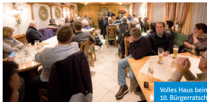
Volles Haus beim 10. Bürgerratsch

Zu unserem 11. Bürgerratsch am 16. Februar 2017 um 20:00 Uhr im Gasthof Adler (Fendt) laden wir Sie recht herzlich ein. Dieses Mal werden unsere Gemeinderäte Sie über den Planungsstand zum Bau der Umgehung B 300 sowie des geplanten dritten Bahngleises informieren. Außerdem möchten wir mit Ihnen den Flächennutzungsplan und freies WLAN diskutieren.